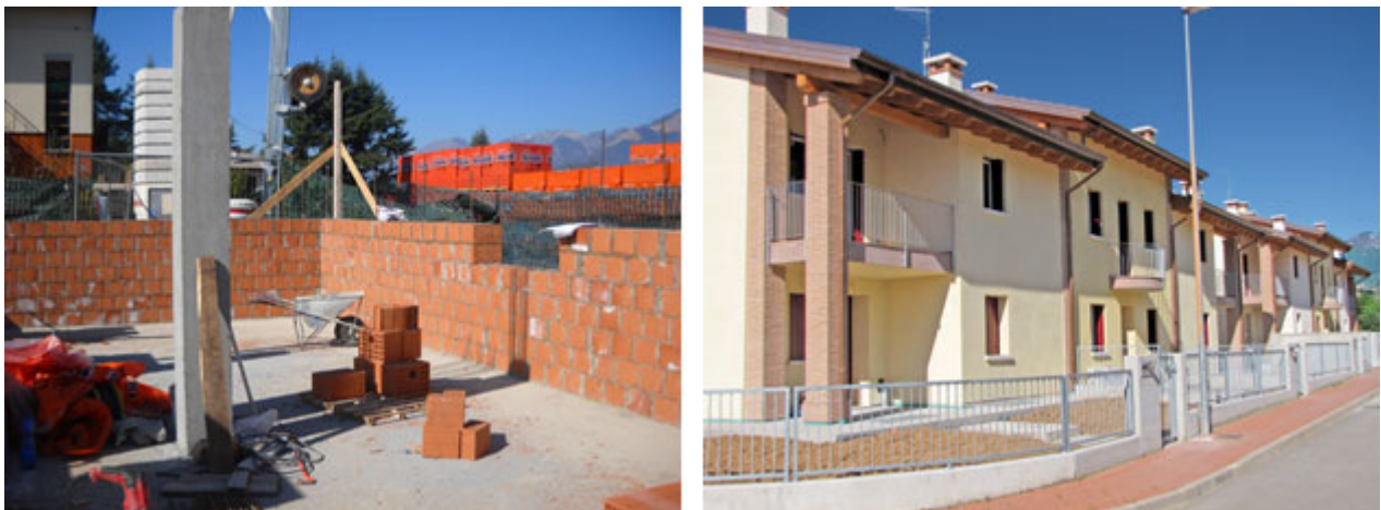
Fig. 1 - Realizzazione tipo di strutture miste: muratura armata perimetrale e pilastro interno (a sinistra), muratura armata perimetrale e pilastro esterno (a destra).

Per edifici di medio-piccole dimensioni la muratura portante impiegata come muratura perimetrale, integrata a pilastri interni e/o esterni, risulta essere una soluzione ideale, anche dal punto di vista economico.