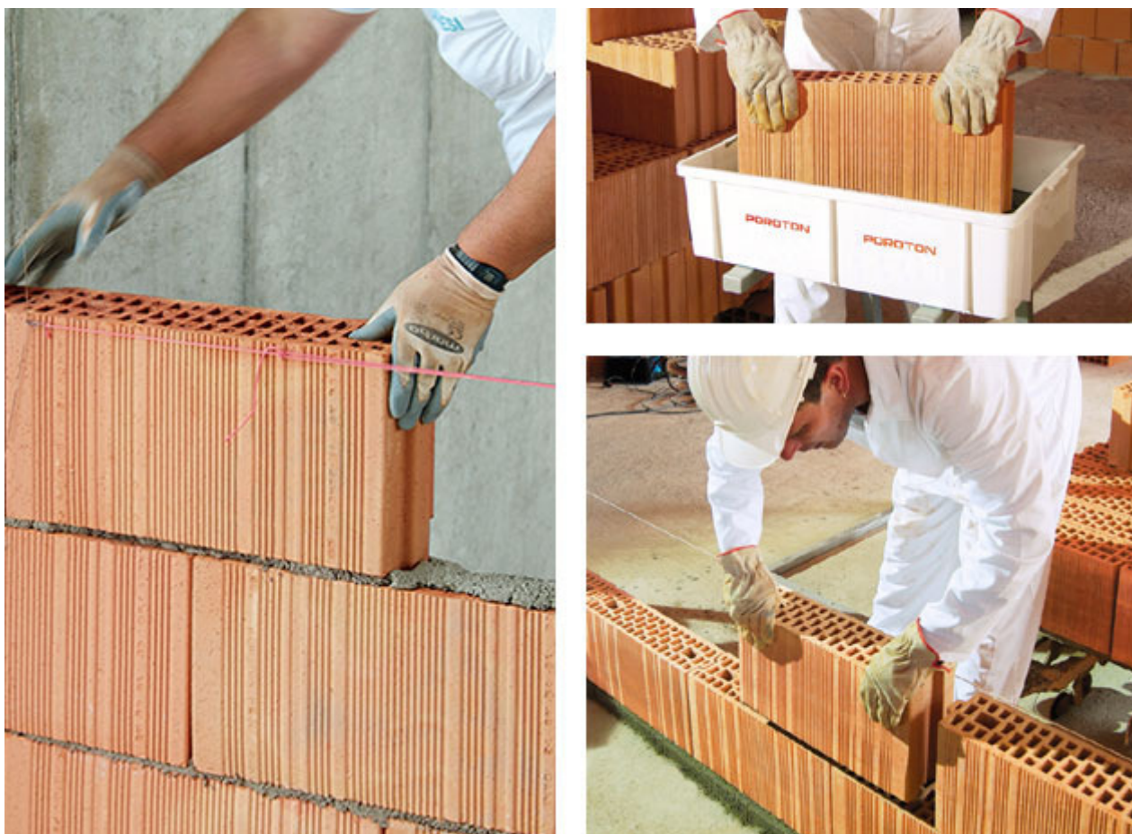
Fig. 2 - Posa di una tramezza POROTON® (a sinistra) e posa di una tramezza POROTON® PLAN (a destra).

Tale sistema, oltre ad una velocizzazione della posa ed alla riduzione del consumo di malta, permette di mantenere molto pulito il cantiere, risultando per questo ideale anche negli interventi di ristrutturazione .