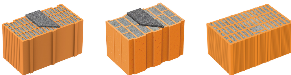
Fig. 1 – Mattoni con isolante integrato: Normablok Più S45, Normablok Più S40 HP, Normablok Più S40 MA.

Poiché questi blocchi innovativi con isolante integrato vengono attualmente prodotti solo in alcuni stabilimenti, per indicazioni in merito a misure e tipologie disponibili è opportuno contattare direttamente la nostra azienda produttrice Fornaci Laterizi Danesi .