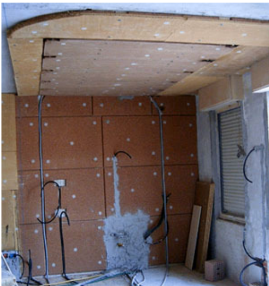
Fig. 5 - Questo particolare tipo di pannello radiante prefabbricato è composto da pannelli in terra cruda (argilla) contenenti una maglia di tubi in rame, che possono essere applicati a secco sulle murature o sui soffitti ed intonacati dopo avere realizzato i necessari collegamenti. Si noti come il sistema dia la possibilità di inserire in maniera semplice tubazioni di altri impianti, come quello elettrico ed idrico.