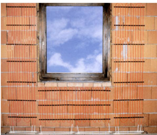
Fig. 6 - I sistemi radianti microcapillari si prestano anche a raffrescare gli ambienti residenziali, previa deumidificazione dei locali con apposita unità necessaria soprattutto in climi caldo umidi.

Per chi non vuole rinunciare al tradizionale fan coil, sicuramente meno confortevole del raffrescamento radiativo, è possibile comunque risparmiare energia tramite un sistema che utilizza il calore prodotto per produrre acqua calda sanitaria.