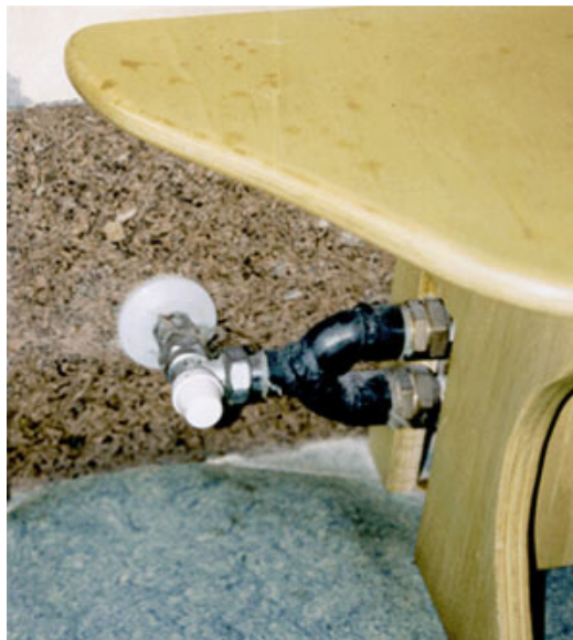
Figg. 3, 4 - Il riscaldamento a battiscopa può essere, come nel caso della scuola materna di Maslianico (CO), ricoperto da un carter in legno disegnato ad hoc e rifinito con finiture naturali. Si veda dal particolare come la fascia retrostante al corpo scaldante sia stata isolata con una striscia di sughero naturale.

Prima di mettere in opera il convettore è opportuno rivestire con una fascia isolante e riflettente la striscia di parete che lo ospiterà, riducendo così le perdite verso l'esterno.